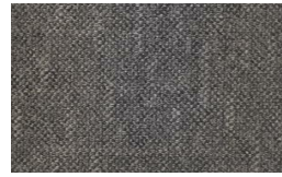
703 - Grove