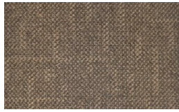
701 - Fairway