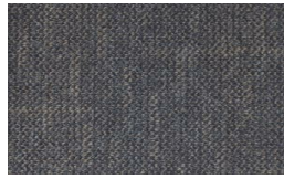
702 - Lane