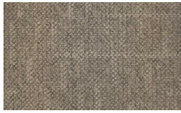
700 - Avenue