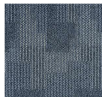
052 - Celeste