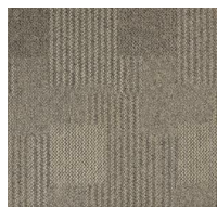
051 - Duna