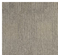
050 - Fendi