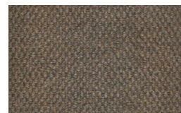
806 - Bege